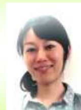
つなく食堂(京都) パティシエ