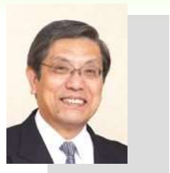
宇治茶伝道師 宇治市商工会議所 副会頭 株式会社山政小山園 顧問

ご来場の皆さんと 石臼体験・聞き茶体験! 《体験者には、バレンタインにぴったり!抹茶チョコをプレゼント》